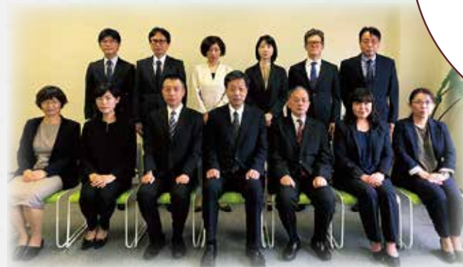
きらり役員集合写真

「きらり」は 老後の保証人、後見人、 逝去後のサポート などを行う 会員制の団体です。 ご入会されたその日から あなたも 「きらりファミリー」 の一員です。