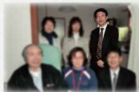
広島ホームテレビ取材時 会員さま、ケアマネジャー、 ヘルパーさんたちと集合写真